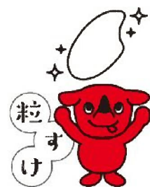
「粒すけ」ロゴマーク

「粒すけ」は、今年から一般生産・販売が開始されました。種子の入手については、各JAにお問い合わせ下さい。また「粒すけ」を取り扱う販売店、飲食店等についてはホームページ https://www.tsubusuke.jp をご参照下さい。